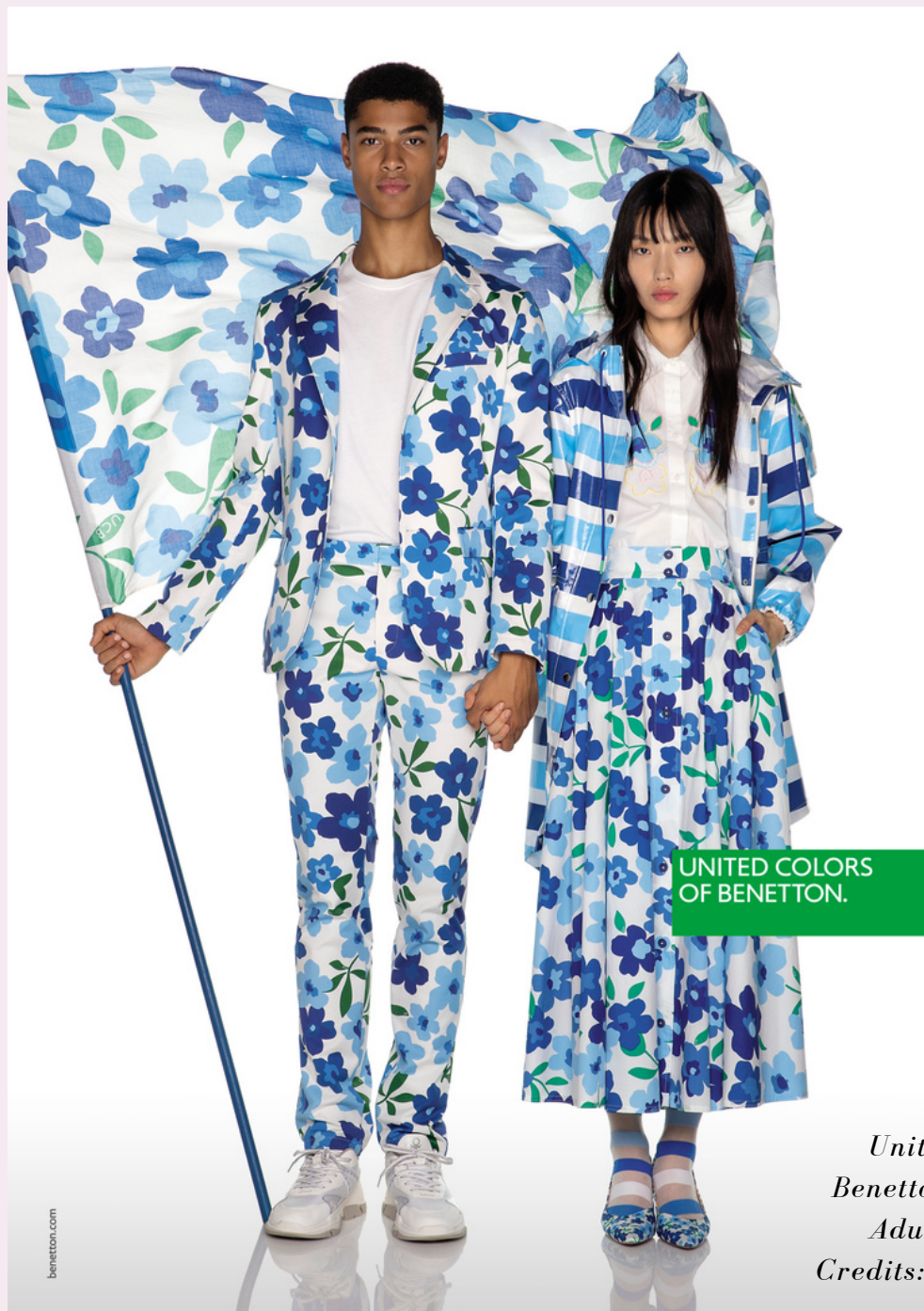
United Colors of Benetton - S/S 2020 - Adult Campaign

Corresponde a las Cortes Generales o al Gobierno, según los casos, la garantía del cumplimiento de estos tratados y de las resoluciones emanadas de los organismos internacionales o supranacionales titulares de la cesión.