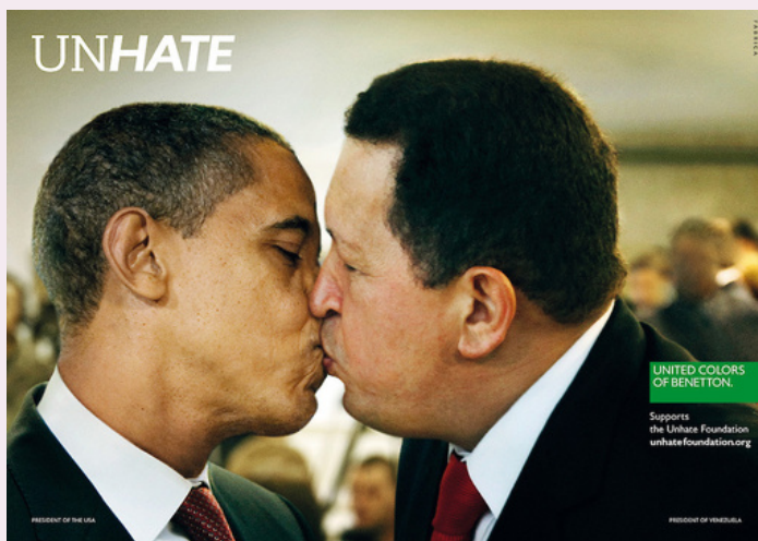
Noviembre 2011 Credits: FABRICA Erik Ravelo co-author

Pero su reconocimiento internacional viene de la mano de Benetton y por ello os dejamos algunas de sus publis de contenido político recientes más impactantes: