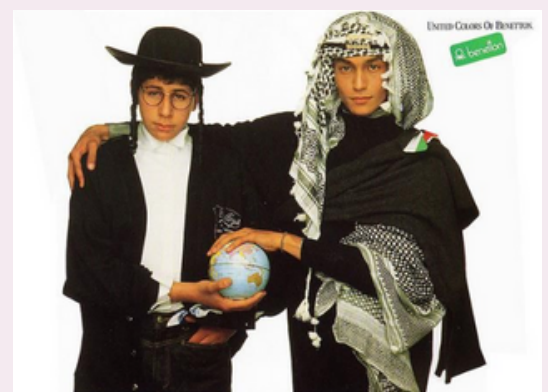
Noviembre 2011 Credits: FABRICA Erik Ravelo co-author