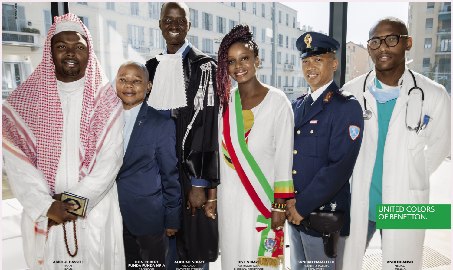
2018_Integration Image - Professionals